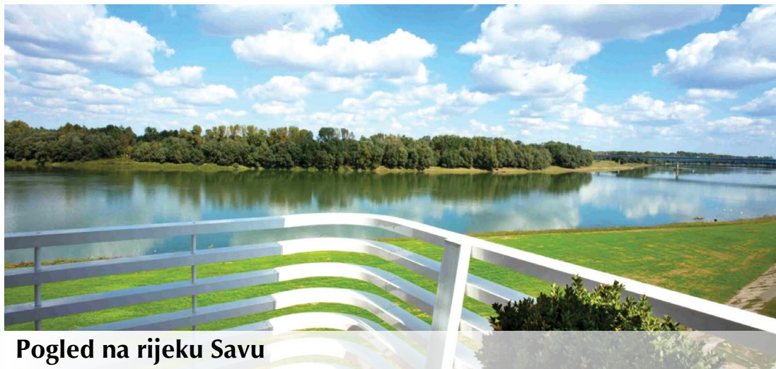
Pogled na rijeku Savu

Najveća crkva u Bosni i Hercegovini u sklopu samostana Tolise je također vrijedan resurs i može postati nezaobilazna točka posjeta za turiste. Muzej u samostanu Tolisa s vrijednim zbirkama veliki je potencijal za razvoj kulturnog turizma i povrh toga gotovo spreman za tržište.